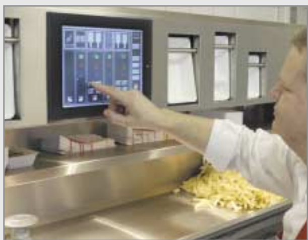
Groot scherm met volledig overzicht van de gehele bakwand, kortom: "total control".