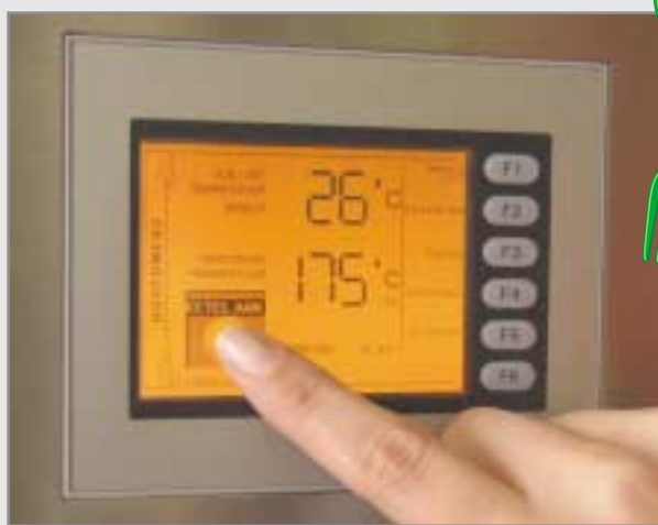
Kleiner amberkleurig scherm per frituurketel met temperatuurinstelling, stand-by stand en instelbare timers.