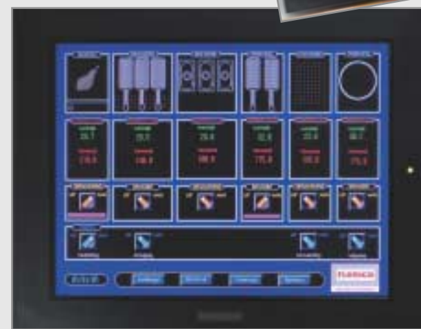
Duidelijke lay-out. Zelfs te gebruiken voor reclame uitingen of aanbieding van de dag!